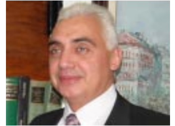
1 Hegel, G. 1985 Lecciones sobre la historia de la Filosofía . México: Fondo de Cultura Económica.

Por ello cada vez somos más los que valoramos enormemente el legado de este filósofo y su defensa de la dignidad individual humana. ■